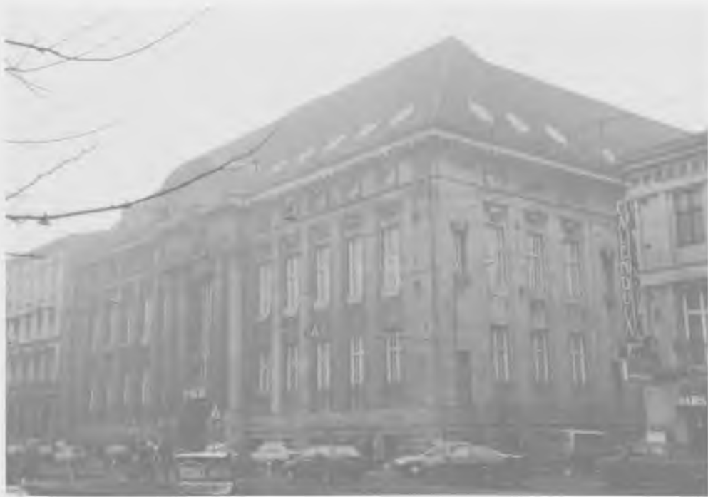
Gmach Banku Handlowego w Łodzi, wzniesiony na początku XX wieku. Stan w roku 1997