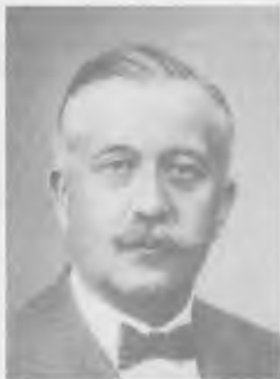
Stanisław Lubomirski (1875–1932)