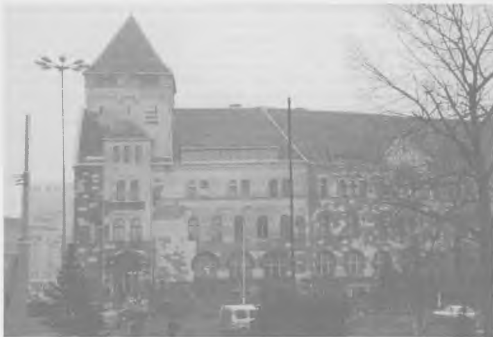
Poznańskie Ziemstwo Kredytowe, gmach wzniesiony w roku 1910. Stan w roku 1997

Towarzystwo Kredytowe Ziemskie w Warszawie powstało w 1825 roku z inicjatywy Ksawerego Druckiego-Lubeckiego. Celem towarzystwa było ułatwienie spłaty długów ciężających na wielkiej własności ziemskiej oraz pomoc finansowa dla rządu Królestwa Polskiego przez udzielanie pożyczek pod zastaw dóbr narodowych. Warunkiem członkostwa TKZ była odpowiednia rozległość dóbr, określona według podatku zwanego „ofiara”, a od 1869 roku