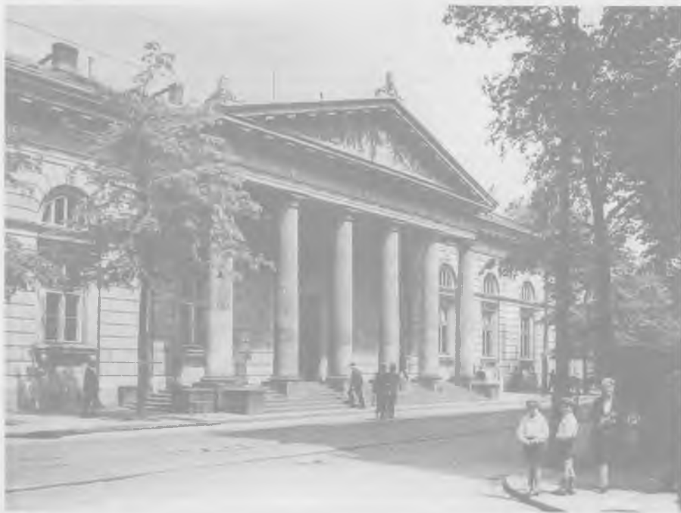
Giełda Pieniężna w Warszawie przy ul. Królewskiej. Stan w roku 1932

Reformy Władysława Grabskiego w 1924 roku doprowadziły do stabilizacji walutowej. W miejsce PKKP utworzony został niezależny od rządu Bank Polski SA, który emitował złote. Grabski, będący zwolennikiem liberalizmu gospodarczego, chciał zarazem zbudować silny sektor państwowy w bankowości. Stanowisko takie wynikało ze świadomości słabości rodzimego kapitału. W 1924 roku dokapitalizowano PKO i PBR, a trzy wywodzące się z Galicji banki publiczne połączono w Bank Gospodarstwa Krajowego (BGK). Zgodnie z planami Grabskiego celem banków państwowych była odbudowa kredytu długoterminowego. Banki prywatne miały się skoncentrować na kredycie krótkoterminowym. Prawo bankowe z 1924 roku opierało się na