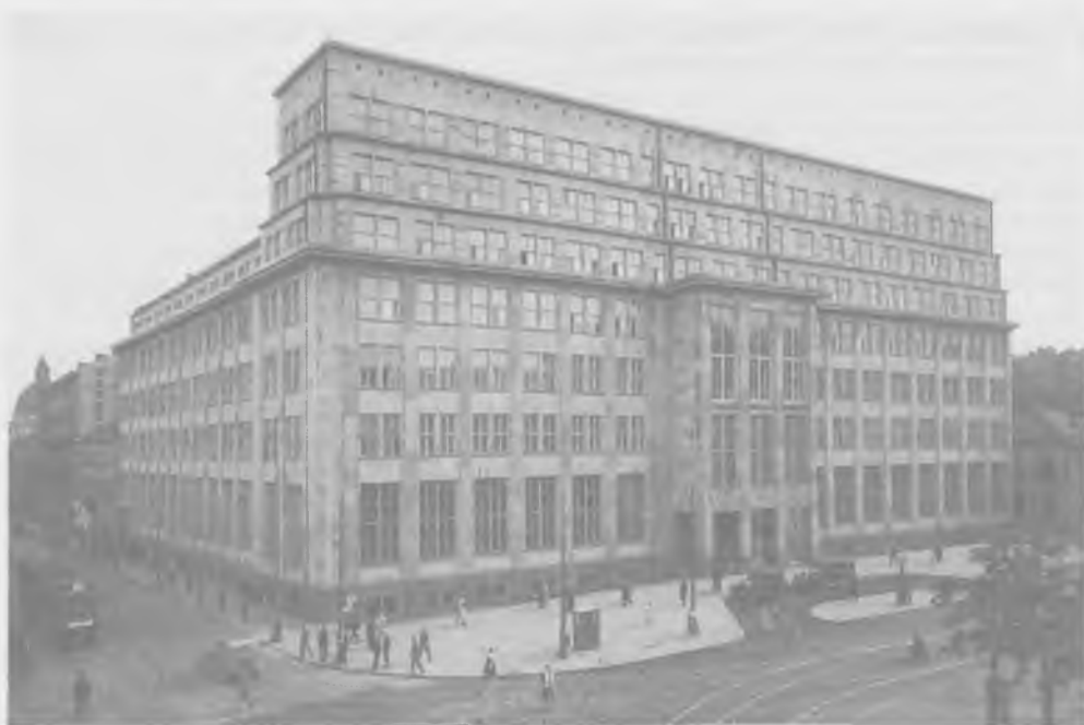
Gmach Banku Gospodarstwa Krajowego w Warszawie, wzniesiony w latach 1928–1931 wg projektu Rudolfa Świerczyńskiego. Stan w roku 1932

Bank Gospodarstwa Krajowego utworzony został na mocy rozporządzeń prezydenta z 30 i 31 maja 1924 roku. Powstał z fuzji trzech wywodzących się z Galicji banków publicznych: Polskiego Banku Krajowego (d. Banku Krajowego), Państwowego Banku Odbudowy