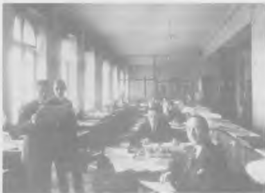
Urzednicy Banku Handlowego w Warszawie przy pracy. Rok 1925

Bank Handlowy w Warszawie był pierwszym i największym bankiem akcyjnym zaboru rosyjskiego. Powstał w 1870 roku z inicjatywy Leopolda Kronenberga. Kronenbergowie przybyli do Warszawy z Prus po III rozbiórce Polski. Samuel Eleazar Kronenberg założył dom bankowy, w 1833 roku przejęty przez syna, Leopolda, który pomnożył majątek dzięki dzierżawie monopolu tytoniowego. Po powstaniu styczniowym, w którym brał udział, musiał na pewien czas opuścić kraj. Po powrocie rozpoczął starania o utworzenie w Królestwie Polskim banku akcyjnego. Po przełamaniu początkowej nieufności władz uzyskano zgodę i w kwietniu 1870 roku firma się ukonstytuowała. Rok później powstała konkurencyjna instytucja – Bank Dyskontowy Warszawski SA. Ambitne plany twórców BHW przyhamował nieco kryzys 1873