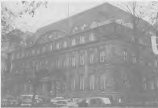
Dawny gmach Ostbanku, w okresie międzywojennym siedziba Banku Związku Spółek Zarobkowych SA. Stan w roku 1997