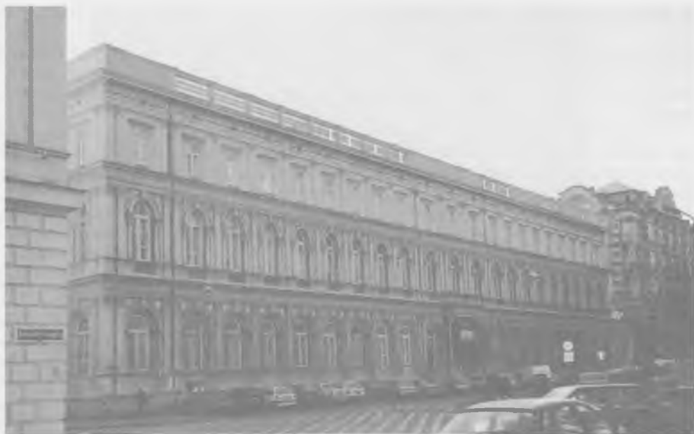
Gmach warszawskiego Towarzystwa Kredytowego Ziemskiego, wzniesiony w latach 1854–1856 wg projektu Henryka Marconiego. Stan w roku 1997