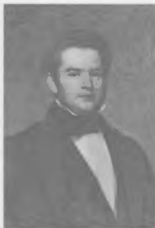
Leopold Kronenberg (1812–1878) inicjator utworzenia Banku Handlowego w Warszawie SA