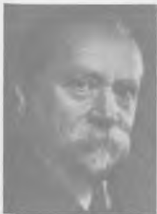
Rafał Szereszowski (1869–1948)

komandytową z kapitałem 3,2 mln rubli. Po śmierci Dawida firmą kierowali dwaj jego synowie – Rafał i Michał. Bardzo pomyślny dla firmy był okres inflacji. Szereszowscy zręcznie wykorzystali koniunkturę, lokując zyski w nieruchomościach i lasach. Zarazem jednak zadbali o niezbędny stopień płynności, dzięki czemu po stabilizacji walutowej ich dom bankowy, z kapitałem ok. 5 mln zł, stał się największym domem bankowym w Polsce. Był też silniejszy od większości banków akcyjnych. Pod kontrolą Szereszowskich znalazło się ugrupowanie obejmujące kilka zakładów przemysłowych oraz 4 tys. hektarów lasu na Polesiu. Dom Bankowy Szereszowski był firmą całkowicie żydowską, co z jednej strony zawężyło krąg ewentualnej klienteli, z drugiej jednak dawało mocną pozycję wśród żydowskich środowisk gospodarczych. Firma utrzymywała kontakty z warszawskim Bankiem dla Spółdzielni SA. Rafał Szereszowski działał społecznie w wielu organizacjach żydowskich, a w latach 1922–1927 był senatorem z listy mniejszości narodowych. W 1923 roku Szereszowscy założyli bank akcyjny. Nie poszli