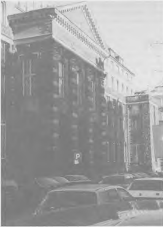
Siedziba Państwowego Banku Rolnego w Warszawie, wzniesiona w latach 1926–1928 wg projektu Mariana Lelewicza. W latach 1946–1951 mieścił się tu Bank Polski SA. Stan w roku 1997

pożyczek w listach zastawnych i obligacjach melioracyjnych (nominowanych w „złoty w złocie”). Ponadto wykonywał normalne czynności bankowe, przyjmując depozyty i prowadząc rachunki czekowe.