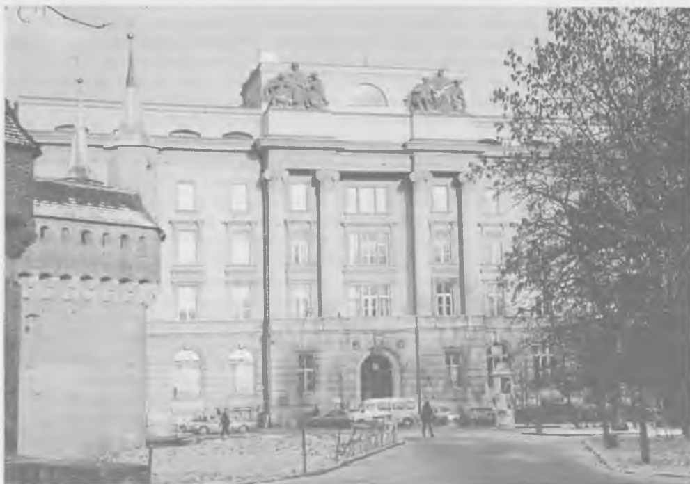
Gmach oddziału Krakowskiego Banku Polskiego wzniesiony w roku 1927. W latach 1940–1945 mieściła się tu centrala Banku Emisyjnego w Polsce. Stan w roku 1997

Już w 1944 roku na wyzwolonych terenach Polski pojawiły się w obiegu banknoty sygnowane przez Narodowy Bank Polski. Faktycznie NBP utworzony został dopiero w styczniu 1945 roku. Bank Polski SA nie odzyskał swych uprawnień emisyjnych i po repatriacji w 1946 roku został postawiony w stan likwidacji (1951). W 1945 roku ukształtował się nowy, pozbawiony elementu konkurencyjności model bankowości, w którym poszczególnym instytucjom kredytowym przypisane były całe sektory życia gospodarczego. BGK zajął się kredytowaniem przemysłu państwowego, PBR – rolnictwa, banki komunalne i sieć KKO – obsługą samorządu terytorialnego, PKO – akcją oszczędnościową, Bank PKO SA – obsługą przekazów pieniężnych