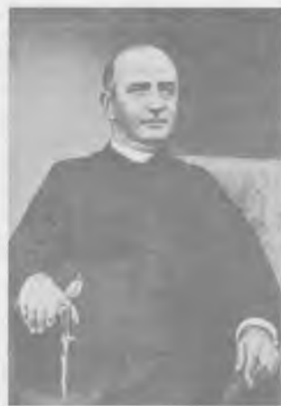
Ks. Augustyn Szamarzewski (1831–1891) patron spółdzielczości kredytowej w zaborze pruskim