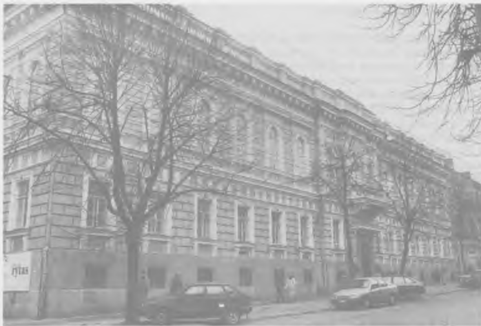
Gmach Wileńskiego Prywatnego Banku Handlowego i Wileńskiego Banku Ziemskiego. Stan w roku 1993