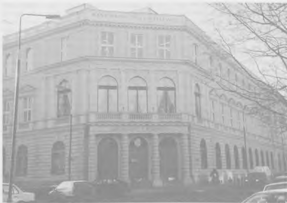
Gmach Banku Handlowego w Warszawie, wzniesiony w 1875 roku wg projektu Konstantego Wojciechowskiego. Stan w roku 1997