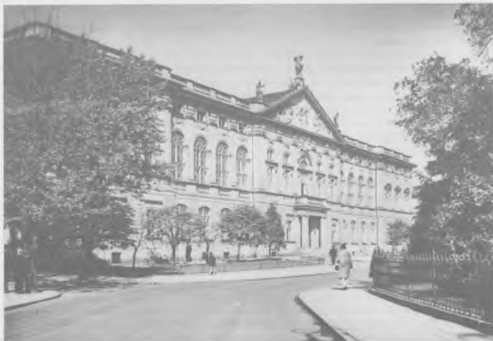
Pałac Krasińskich w Warszawie, siedziba Głównej Kasy Wymiany Księstwa Warszawskiego. Stan w roku 1930