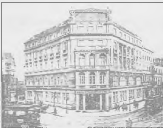
Bank Cukrownictwa SA w Poznaniu.

Bank Cukrownictwa powstał latem 1921 roku z inicjatywy działającego od stycznia 1920 roku Związku Zachodnio-Polskiego Przemysłu Cukrowniczego, zrzeszającego 24 cukrownie byłego zaboru pruskiego. W momencie powstania dokonano fuzji z działającym od 1886 roku Bankiem Ziemią SA w Poznaniu. Bank Cukrownictwa był jednym z wielu założonych podczas inflacji banków branżowych. Większość z nich znikła po stabilizacji walutowej. Bank Cukrownictwa był jednym z dwóch banków (obok Banku Naftowego SA), które przetrwały, ponadto z czasem wyrósł na jedną z największych instytucji kredytowych w Polsce. W 1923 roku, po porozumieniu trzech