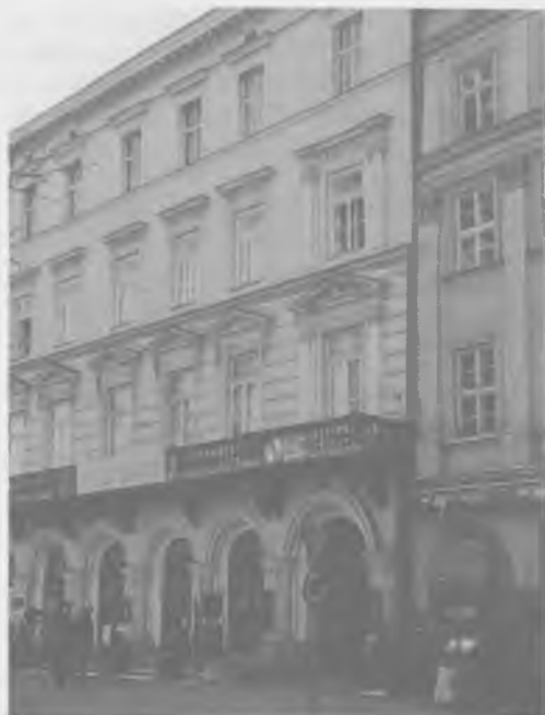
Siedziba Banku Małopolskiego w Krakowie. Stan w roku 1997

Sprawozdanie za rok 1881: BN (sygn. VI. A5) Bank Małopolski SA w Krakowie, „Przemysł i Handel” nr 1/1924 W. Morawski – Bank Małopolski SA w Krakowie, SBP, „Gazeta Bankowa” nr 11/1989 R. W. – Z rozwoju Banku Małopolskiego SA w Krakowie, „Kurier Polski” z 29 czerwca 1921