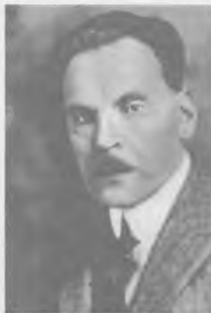
Władysław Wróblewski (1875 – 1951) w latach 1929 – 1936 prezes Banku Polskiego SA, w latach 1933 – 1939 prezes Banku Akceptacyjnego SA