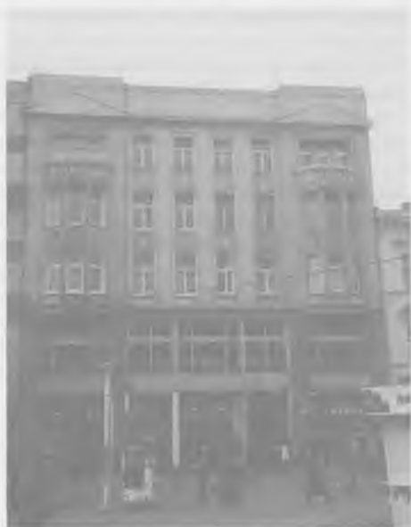
Bank Polskich Kupców i Przemysłowców Chrześcijan w Łodzi SA. Stan w roku 1997

W. Morawski – Mniejsze banki krakowskie, SBP, „Gazeta Bankowa” nr 9/1990