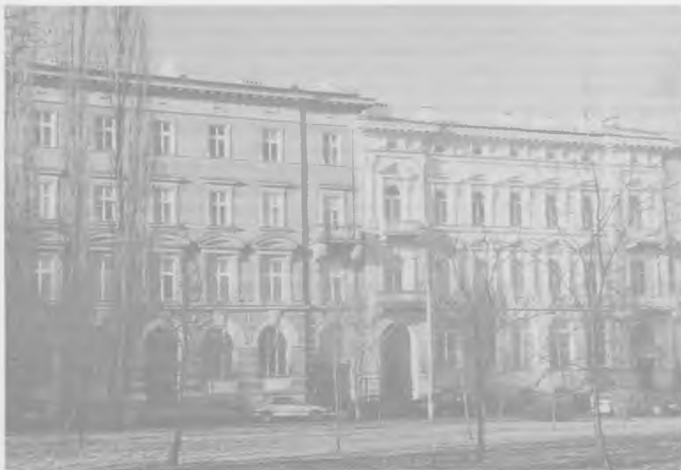
Ocalałe z wojny gmachy Banku Dyskontowego Warszawskiego (po lewej) i Banku Zachodniego (po prawej) przy ulicy Fredry w Warszawie. Siedzibę Banku Dyskontowego wzniesiono w latach 1896–1897 wg projektu Kazimierza Loewego, siedzibę Banku Zachodniego – ok. roku 1900 wg projektu Józefa Piusa Dziekońskiego. Stan w roku 1997