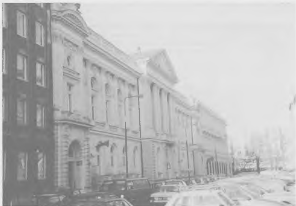
Gmach warszawskiego Towarzystwa Kredytowego Miejskiego, wzniesiony w latach 1878–1880 wg projektu Juliana Ankiewicza. Dalej widać fasadę Banku Handlowego w Warszawie. W okresie międzywojennym perspektywę ul. Czackiego zamykała fasada Banku dla Handlu i Przemysłu. Stan w roku 1997

Lubelskie TKM, założone w 1885 roku, w latach trzydziestych emitowało listy mniej więcej na 10 mln zł.