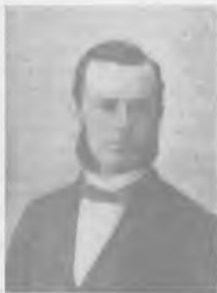
Jan Gotlib Bloch (1836–1902)

Stosunkowo słaby rozwój domów bankowych w zaborach austriackim i pruskim wynikał m.in. z łatwości, z jaką można było założyć tam bank akcyjny. Restrykcyjne rosyjskie prawo bankowe powodowało, że w zaborze rosyjskim ta forma organizacyjna zachowała znaczenie również w epoce banków akcyjnych.