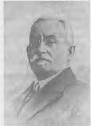
Franciszek Stefczyk (1861–1924) twórca „kas Stefczyka” w Galicji

W 1873 roku powstał Wspólny Zakład Kredytowy dla Galicji i Bukowiny, będący pierwszą spółdzielnią ukraińską. Zakład przetrwał do 1883 roku. W 1894 roku założona została podobna spółdzielnia – Towarzystwo Wzajemnego Kredytu „Wira” w Tyśmienicy koło Stanisławowa. Do końca stulecia powstało kilkanaście dalszych tego typu instytucji, spośród których szczególne znaczenie zyskało lwowskie Towarzystwo Wzajemnego Kredytu „Dniestr” 24 . W 1898 roku spółdzielnie ukraińskie utworzyły związek rewizyjny – Krajowy Sojuz Kredytowyj we Lwowie. W 1899 roku powstała centrala finansowa spółdzielczości ukraińskiej – Centralnyj Kooperatywny Bank Krajowyj Sojuz Kredytowyj, zwany potocznie „Centrobankiem”. Odrębnie rozwijały się znacznie mniej liczne „rusińskie”, tzn. odcinające się od ukraińskiego nacjonalizmu, spółdzielnie kredytowe. W 1908 roku założyły Związek Rewizyjny Ruskich Spółdzielni we Lwowie. Centralą finansową tego ruchu stał się, założony już w 1896 roku Kredytowyj Sojuz „Zaszczyta Zemli” we Lwowie. Nieco inny charakter miały kasy pożycz-