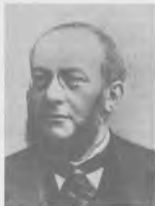
Hipolit Wawelberg (1843–1905)