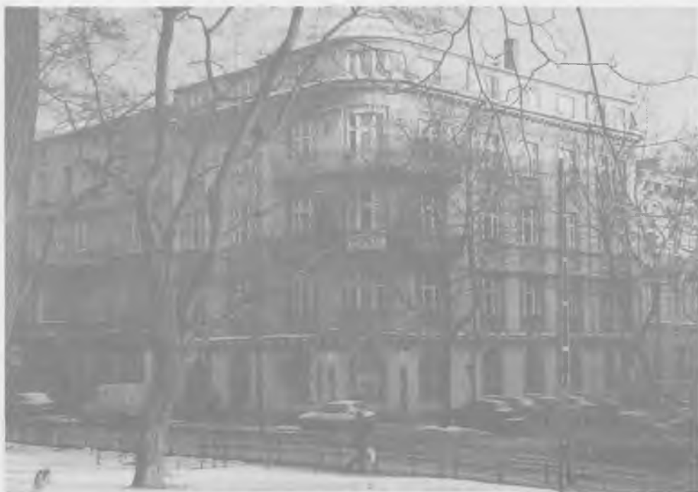
Dom Bankowy A. Holzer w Krakowie, od lipca 1939 roku – Bank Krakowski SA. Stan w roku 1997