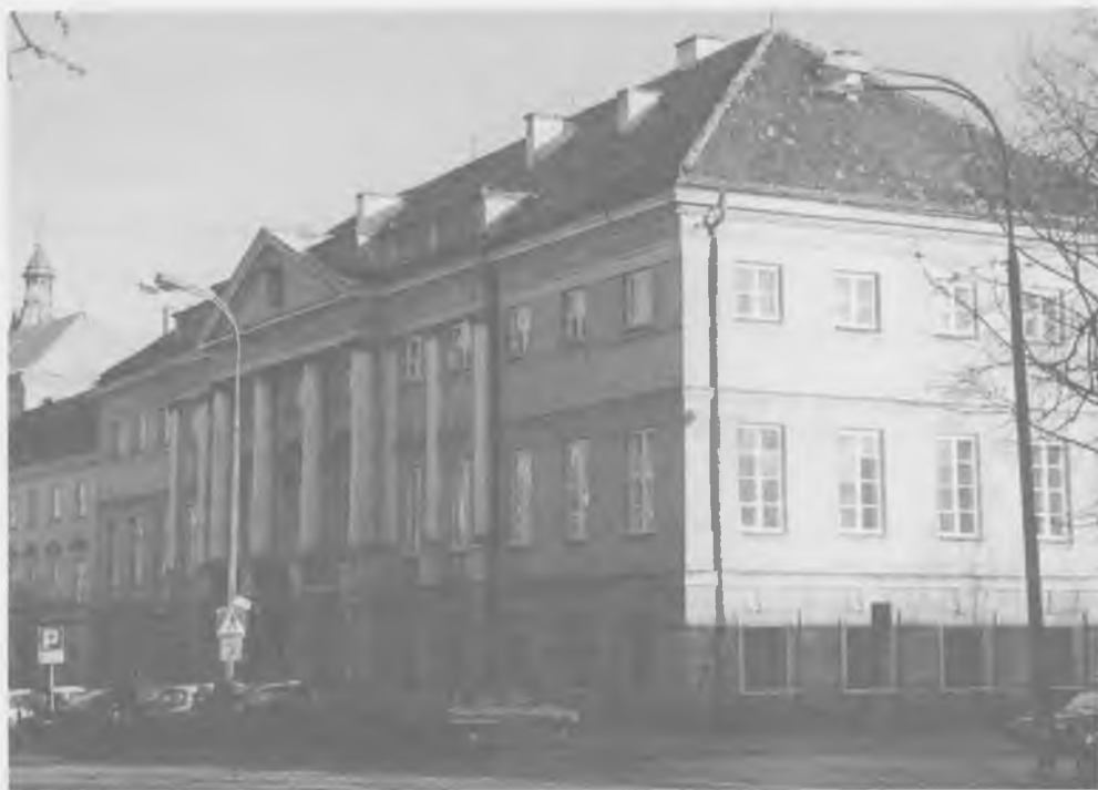
Pałac Raczyńskich przy ul. Długiej w Warszawie. W roku 1794 siedziba Dyrekcji Biletów Skarbowych. Obecnie Archiwum Główne Akt Dawnych. Stan w roku 1997