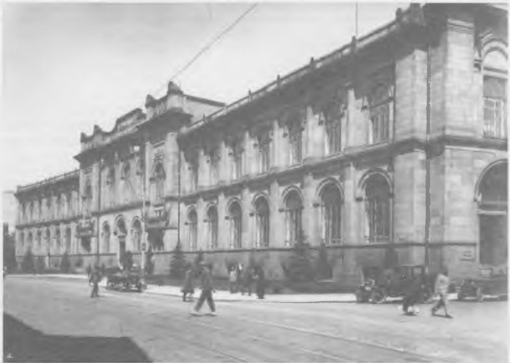
Gmach Banku Polskiego w Warszawie, wzniesiony w latach 1907–1910. Stan w roku 1929

Banknoty emitowane po listopadzie 1918 roku różniły się od poprzednich zarówno wyglądem, jak i brakiem gwarancji niemieckich. Kwestia wykupienia przez Niemcy emisji okupacyjnej była dyskutowana w 1919 roku. Z uwagi na Ententę (było to jeszcze przed podpisaniem traktatu wersalskiego) Polska musiała w tym czasie unikać zbyt wielu kontaktów z Niemcami i rozmowy zerwano. Powrócono do sprawy w 1922 roku i wówczas Niemcy wykupili swe zobowiązania, z powodu inflacji była to już jednak suma znikoma.